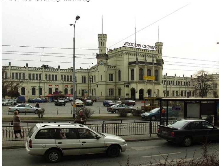
.. i dziś.