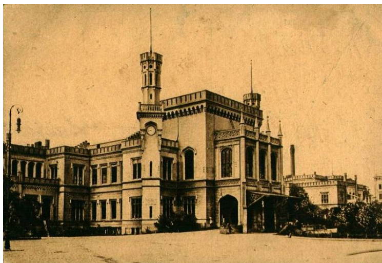
Dworzec Główny dawniej

Piotr i Adrian zgromadzili imponującą liczbę zdjęć dawnego Breslau – zwłaszcza dotyczących miejsc, w których bywał bohater literacki, radca kryminalny Eberhard Mock. Fotografie te skonfrontowane zostały ze zdjęciami współczesnego Wrocławia, co zrobiło na widzach niemałe wrażenie.